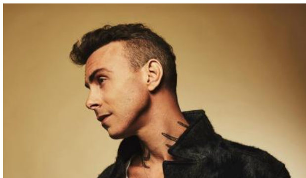
La star pop israélienne Asaf Avidan sur scène à Albertville le 26 juillet 2018

"Benjamin Tanguy apporte son expérience et ses réseaux à notre festival en pleine croissance", se félicite Nicolas Folmer, réaffirmant la volonté des organisateurs de l'événement musical qui rayonne bien au-delà d'Albertville, de miser sur la diversité du répertoire jazz et ses liens avec les musiques actuelles. A l'image de la venue exceptionnelle sur la scène albertvilloise, de la pop star Asaf Avidan, "l'homme à la voix d'or", qui sera en solo pour un concert guitare et voix très attendu (26/07). Autre tête d'affiche grand public, Charlie Winston, multi-instrumentaliste, qu'on aurait tort de réduire à ses tubes planétaires Like a Hobo et In Your Hands ! Il revient cet été avec un projet jazz (27/07).