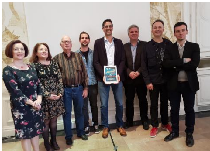
Les élus et l'équipe du festival

Culture | Publié par La rédaction le Mercredi, 4 Avril, 2018 - 13:01.